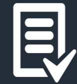
ФОТО и ВИДЕООТЧЕТЫ

Мониторинг размещения визуальной рекламы